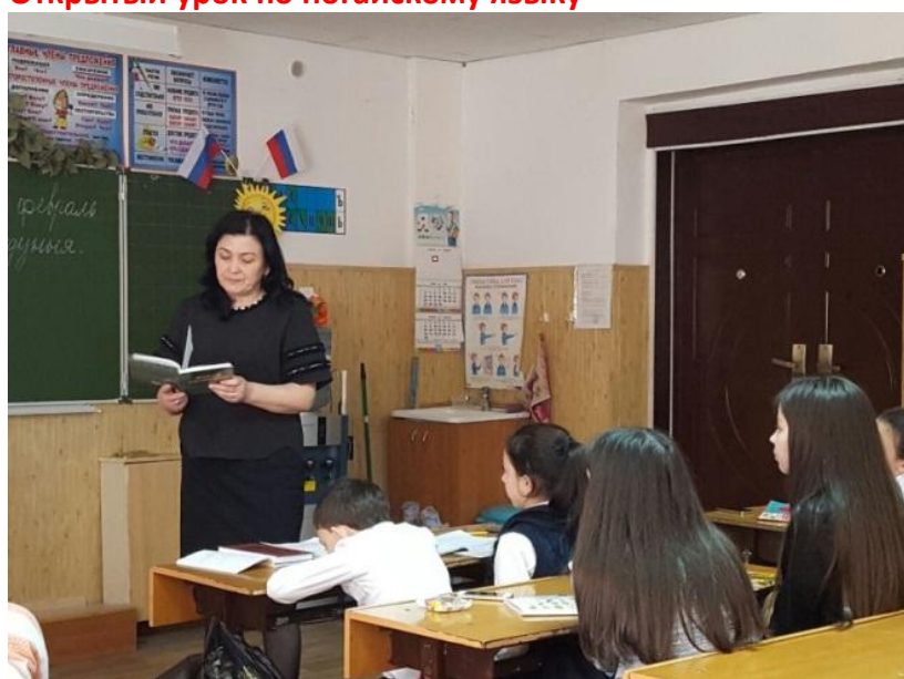
Открытый урок по карачаевскому языку