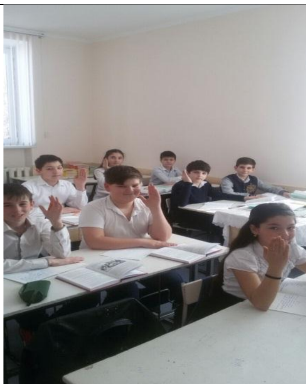
Открытый урок по ногайскому языку