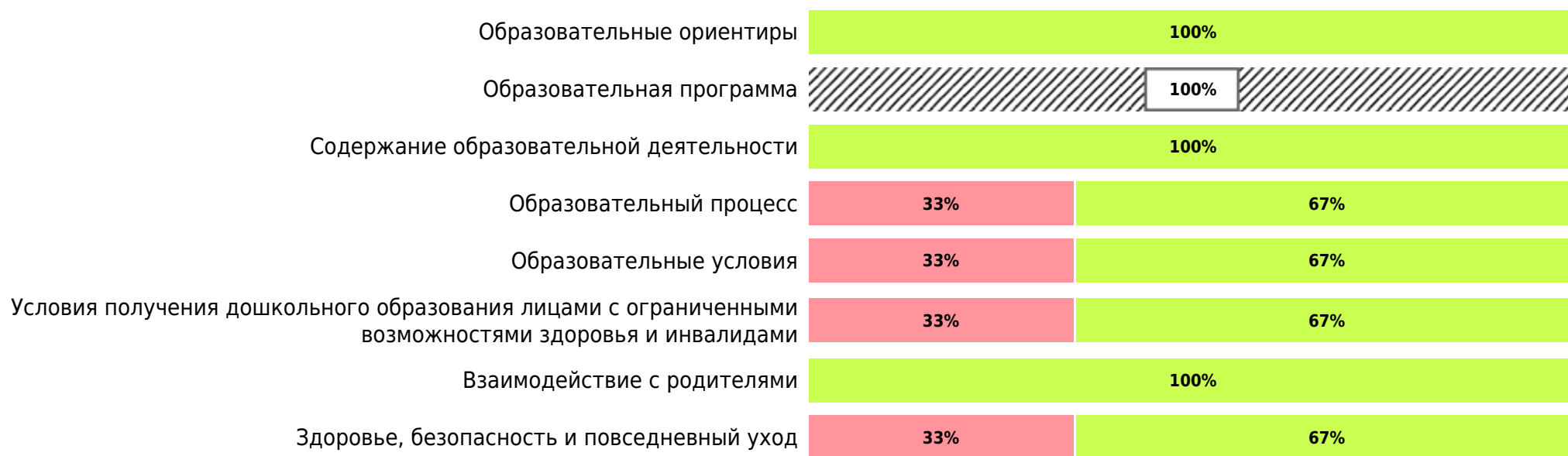
Доли ДОО с разными баллами у их ООП ДО ДОО (самооценка)

В процессе самооценки было оценено 33 ООП ДО ДОО из 3 ДОО субъекта РФ.